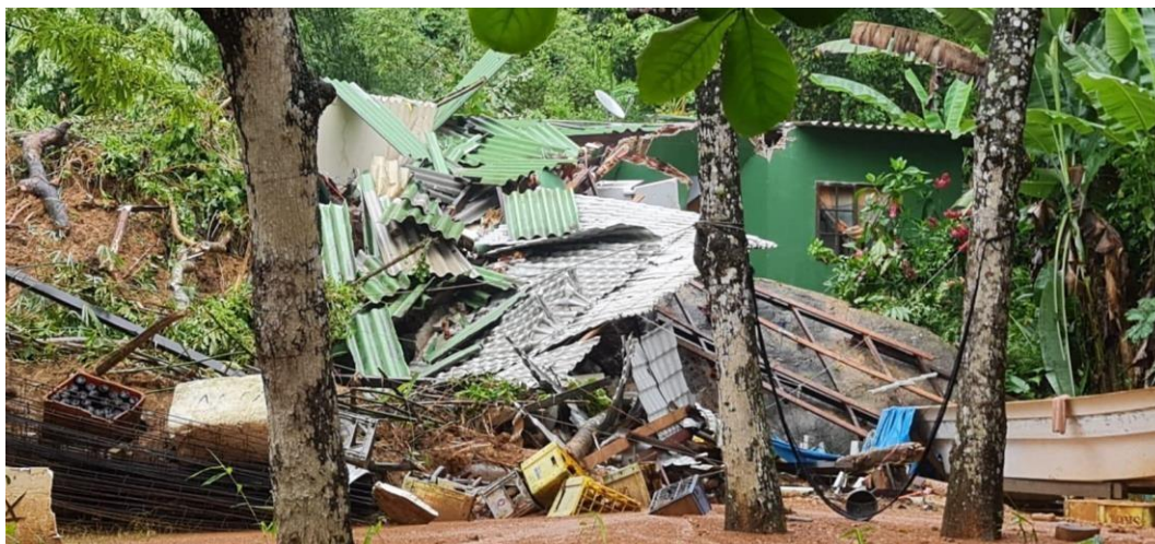
Figura 2: Desabamento de casa durante o desastre de 2022 na RDS do Aventureiro