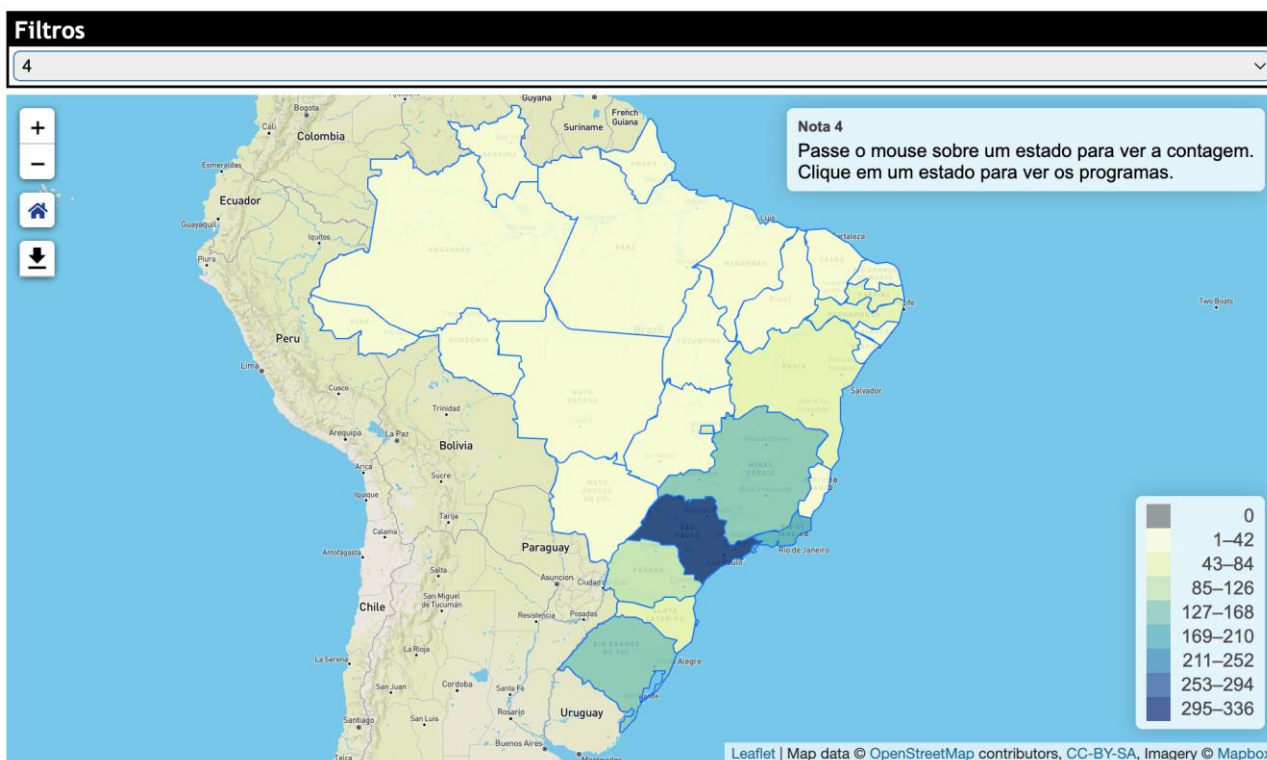
Figura 2 - Mapa de Programas por Nota e Estado.