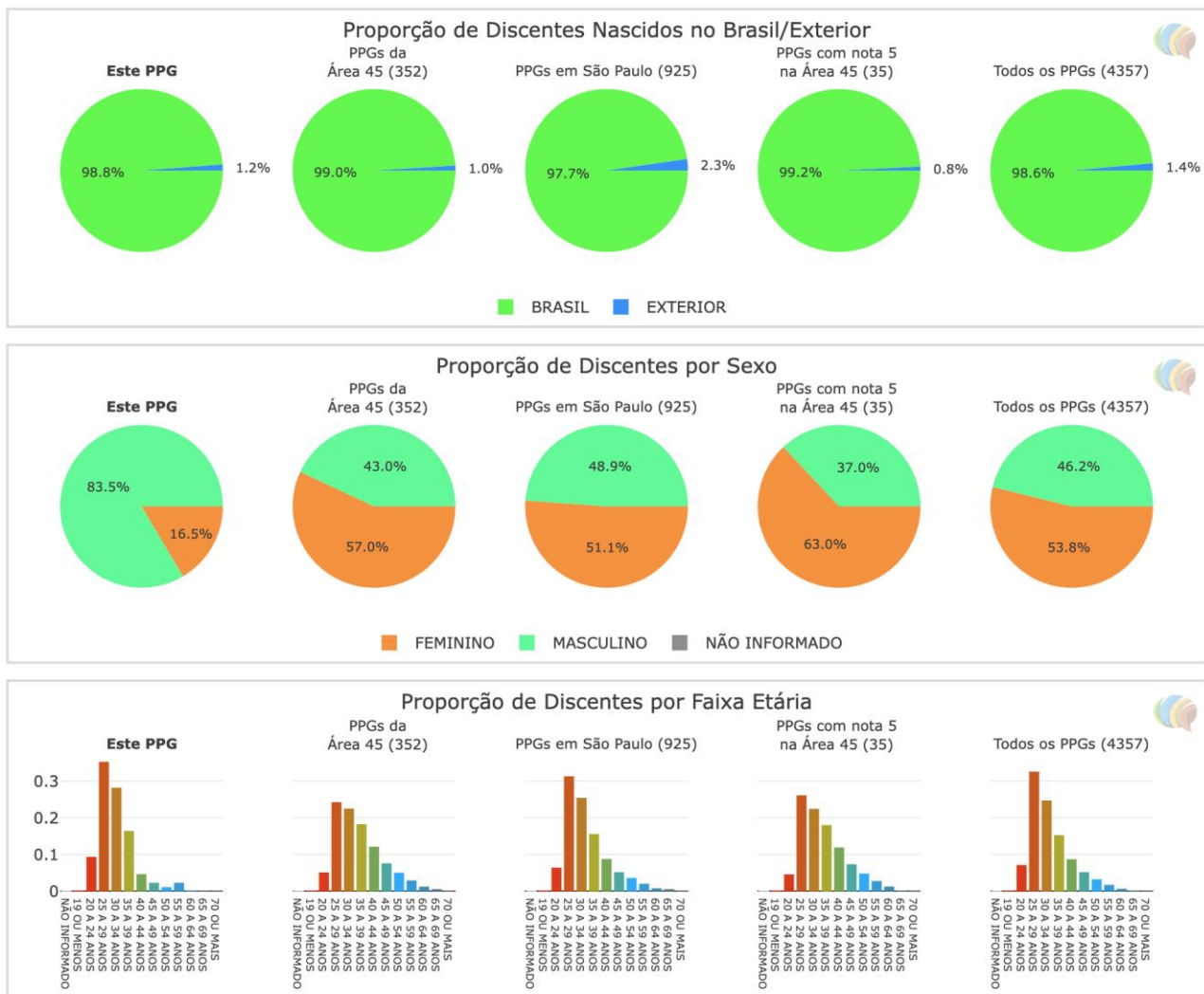
Figura 4 - Estatísticas sobre Discentes dos Programas Interdisciplinares.

Outra ação prevista para o Fórum é o levantamento de boas práticas, ferramentas e metodologias usadas por programas mais experientes ou mais bem avaliados (não limitando a programas da área interdisciplinar) para compartilhamento e adoção por outros programas interessados. Em particular isto será incentivado para ações, metodologias e ferramentas para acompanhamento de egressos, mensuração do impacto das ações dos programas na sociedade, processos de autoavaliação e planejamento estratégico (WADE, 2022) e outros que levem à melhor organização dos programas e atendimento aos seus objetivos.