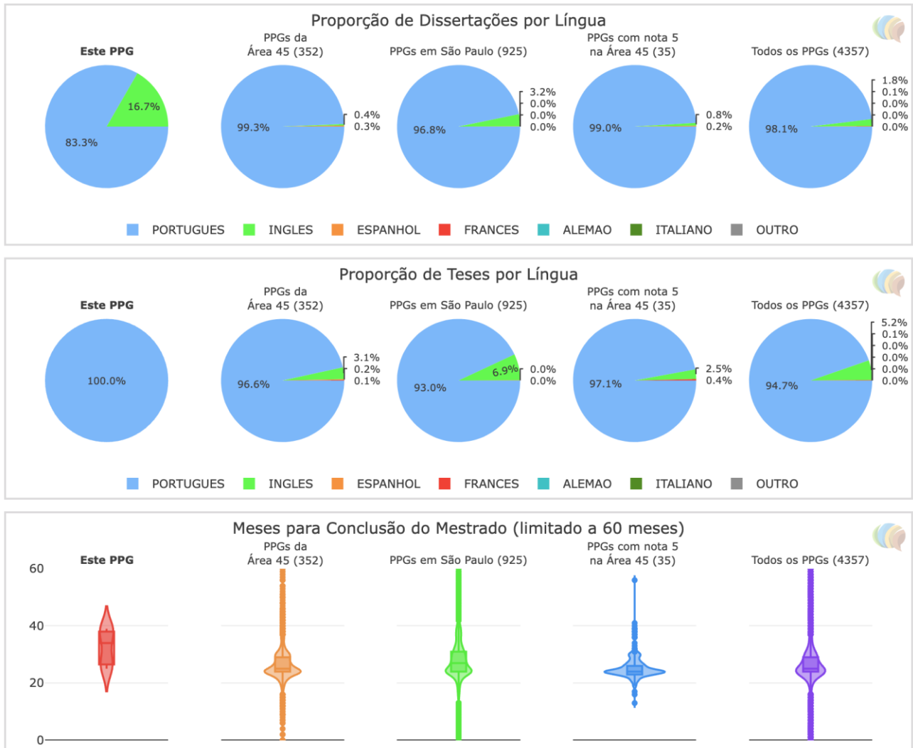
Figura 3 - Comparações entre Dados de Teses e Dissertações e Tempo para Graduação.